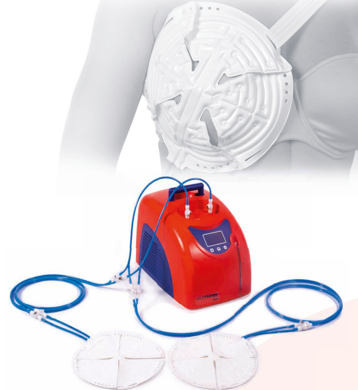
Calido Gerät mit zwei Anschlüssen inkl. zwei Rundmanschetten

Mit der HILOTHERAPY® Calido bereiten wir das Gewebe bereits im Vorfeld der Operation auf eine mögliche Minderdurchblutung vor, um es so vor einem Absterben zu schützen. Rund 18 Stunden vor der Operation wird eine lokale Wärmeapplikation bestehend aus drei Wärmezyklen à 30 Minuten mit einer Temperatur von 35–43 °C, jeweils unterbrochen durch eine passive Abkühlphase bei Raumtemperatur, am betroffenen Gewebe durchgeführt. Dies führt zu einer Gefäßerweiterung und somit zu einer verbesserten Durchblutung. Gewebsbereiche, die einer anhaltenden Minderdurchblutung oder einem kompletten Durchblutungsausfall ausgesetzt sein könnten, können so vor dem Absterben geschützt werden.